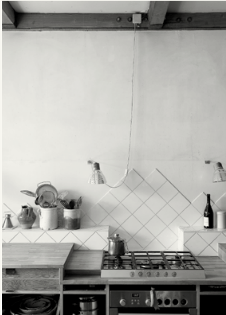
Hinterfragen von Ausbaustandards: Selbstbau im Sechsfamilienhaus in München-Perlach von Ralph und Doris Thut aus dem Jahr 1978.