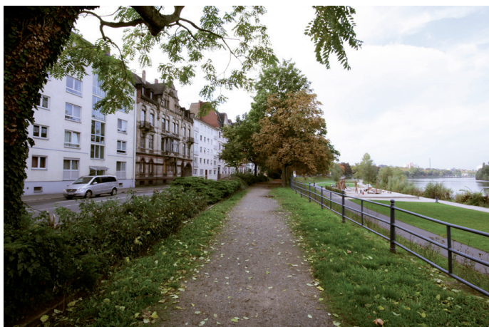
Erholungsgebiet am Mainufer