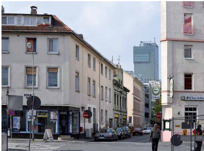
Kreuzung Karlstraße Ecke Hermann Steinhäuser Straße