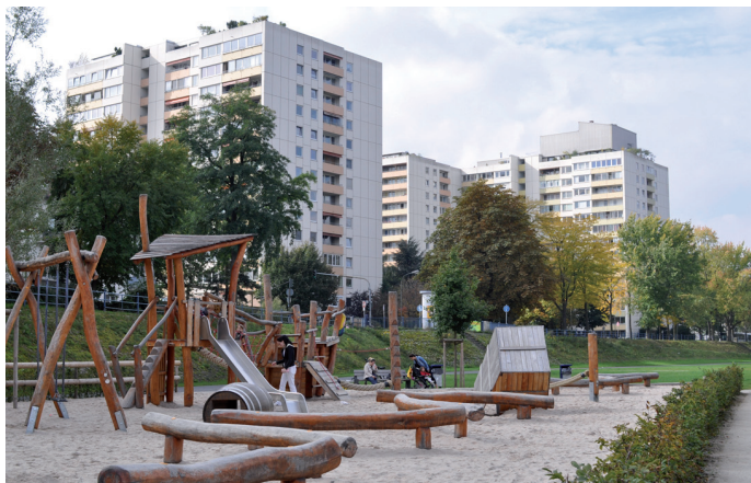
Kinderspielplatz am Main