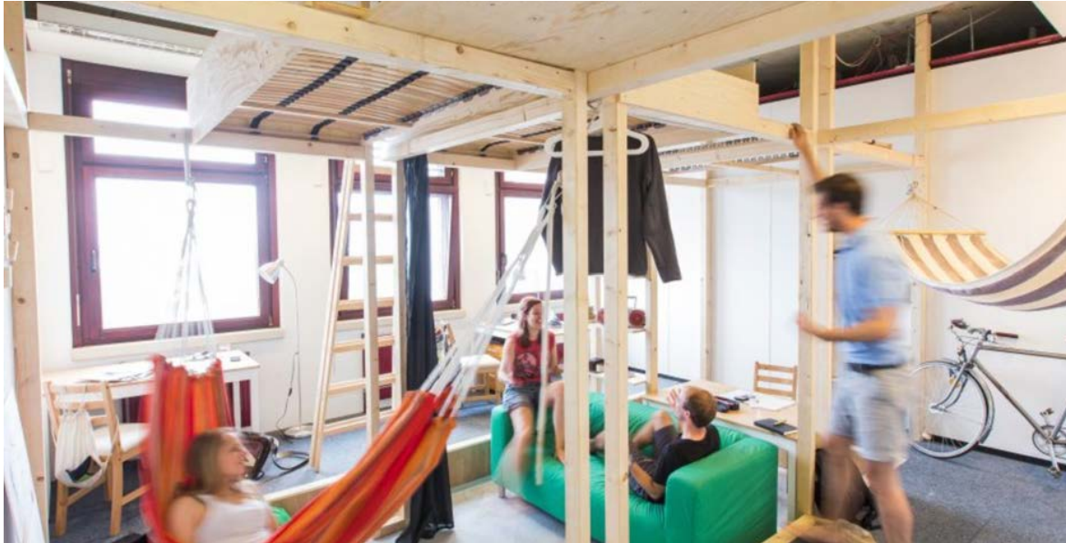
Abb. 1 Home not Shelter! Wien 2016, Traudi Prototyp

Dafür gibt es verschiedene Beispiele und Ansätze: