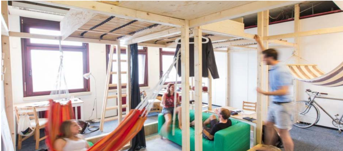
Abb. 5 Home not Shelter! Wien 2016, Traudi Prototyp , Quelle: Hans Sauer Stiftung

The integration of people requires spaces and infrastructures. This is not only about accommodation or more or less temporary housing offers, but also places or spaces where people can work, meet, network or pursue social activities. Care, education and leisure activities for children and young people also play an important role due to the demographics of the refugees.