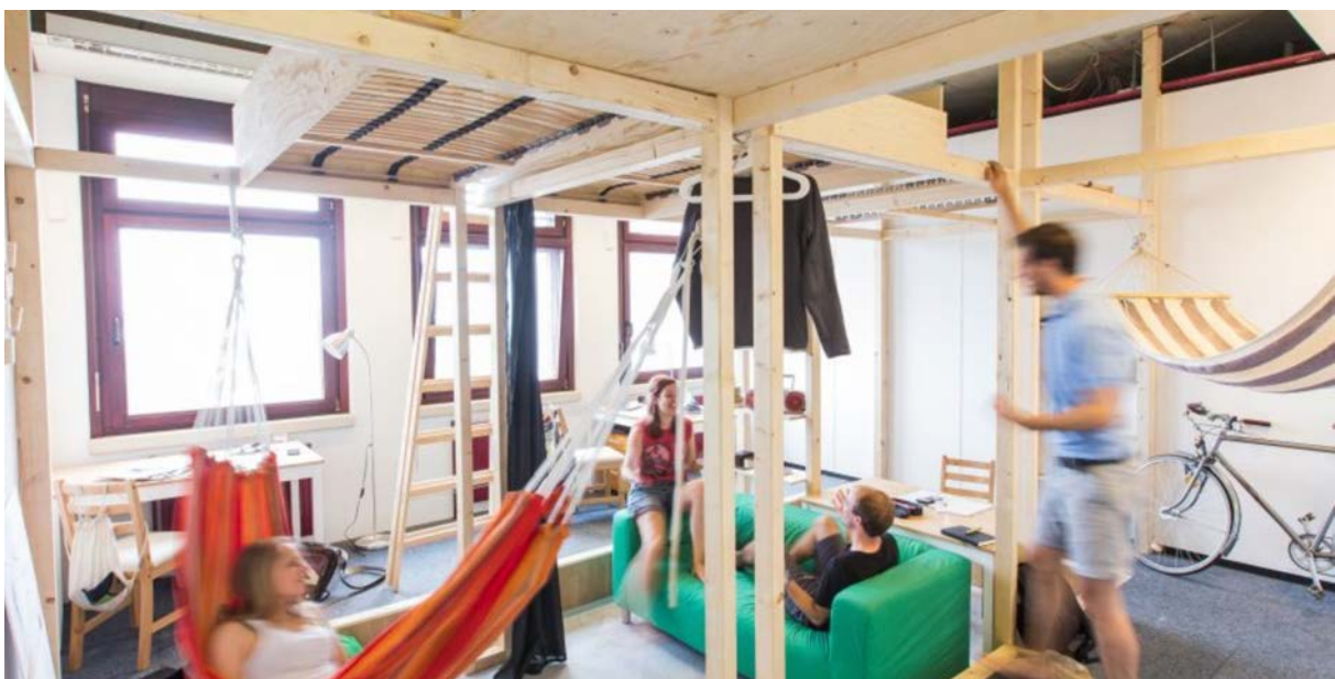
Фото 9 Home not Shelter! Відень 2016, Traudi Prototyp

Інтеграція людей вимагає простору та інфраструктури. Йдеться не лише про житло чи більш-менш тимчасове житло, а й про місця, де люди можуть зустрічатися, спілкуватися, працювати чи займатися громадською діяльністю. Догляд, уроки та дозвілля для дітей та молоді також відіграють важливу роль у зв'язку з демографічним складом біженців.