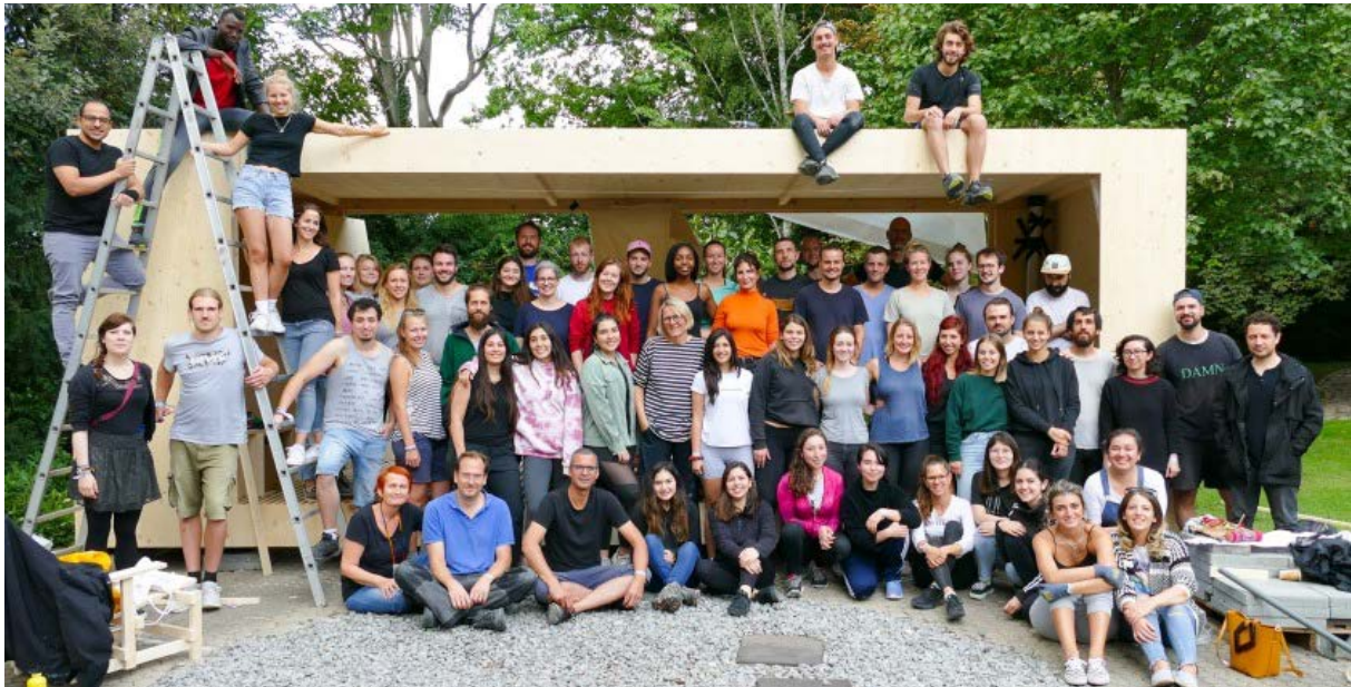
Фото 11 Home not Shelter! Літня школа Створюємо дім разом, Маннгайм, 2019

Влітку 2022 року міжуніверситетська літня школа в Штутгарті розпочне реалізацію перших проектів Design-Build у Штутгарті на основі імпровізованих проектів. IBA27 підтримує університети-учасники в реалізації літньої школи.