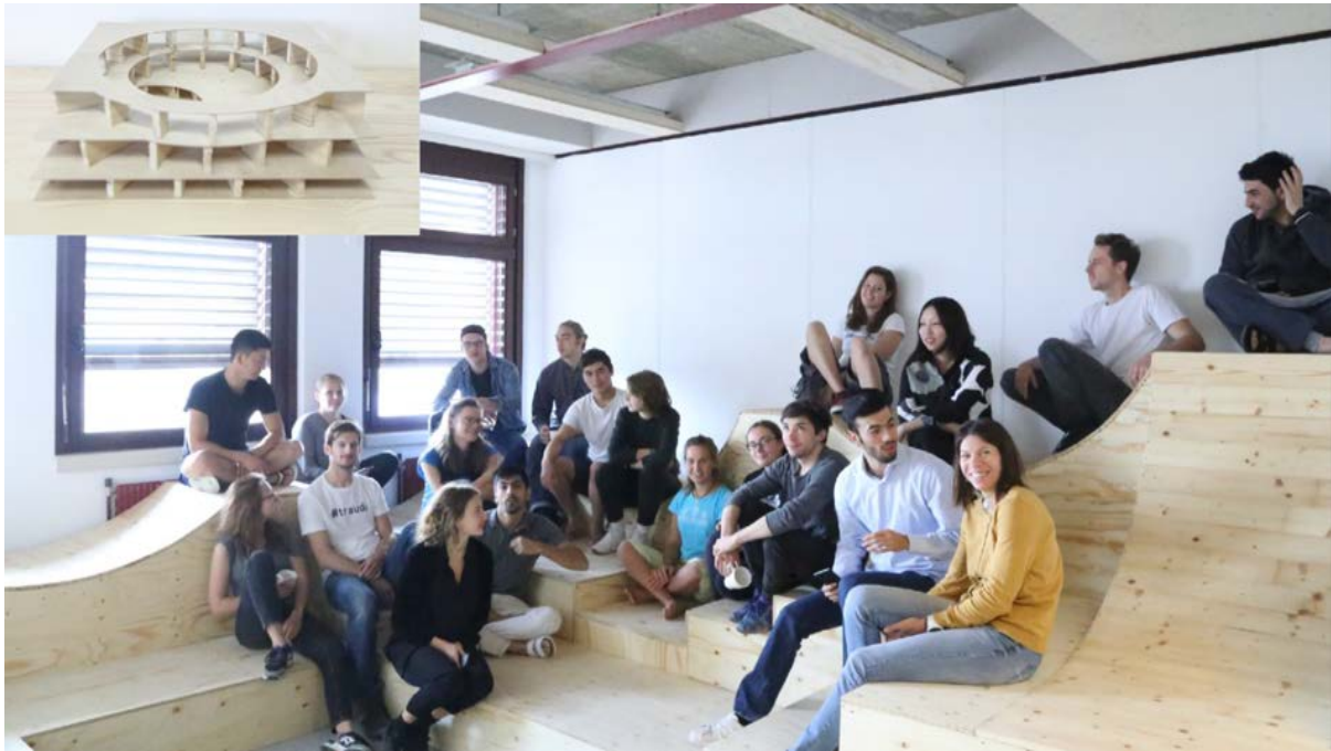
Фото 10 Home not Shelter! Літня школа 2016, ТУ Відень та ТУ Берлін

У різних університетських локаціях у літньому семестрі 2022 року на теоретичному рівні будуть готуватися так звані «проектно-будівельні ініціативи», студентські проекти планування та будівництва, які мають бути реалізовані в зимовому семестрі. Оскільки підготовка цих проектів безпосередньо в запланованих місцях, ймовірно, все ще буде складною через пандемічні умови, слід розробити стратегії та підходи, які є максимально далекосяжними і які можна легко застосувати до різних місць і типів будівель.