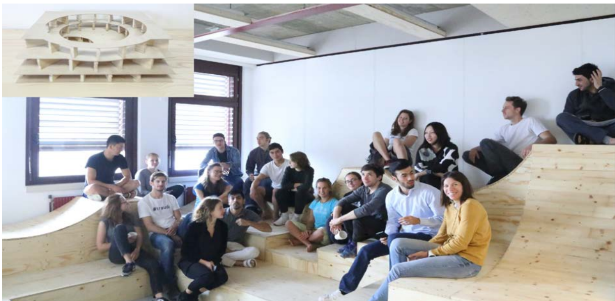
Abb. 6 Home not Shelter! Summer Academy 2016, TU Vienna und TU Berlin

At the various university locations, so-called "design-build projects" will be prepared on a theoretical level in the summer semester of 2022. Students, planning and construction projects, that are to be given actual implementation in the winter semester. Since it will be probably still difficult to prepare these projects directly at the intended locations due to the pandemic conditions, the aim is to develop strategies and approaches that are transferable and can be easily applied to different locations and building types and can also prepare for the integration of the winner-projects of the current ideas competition.