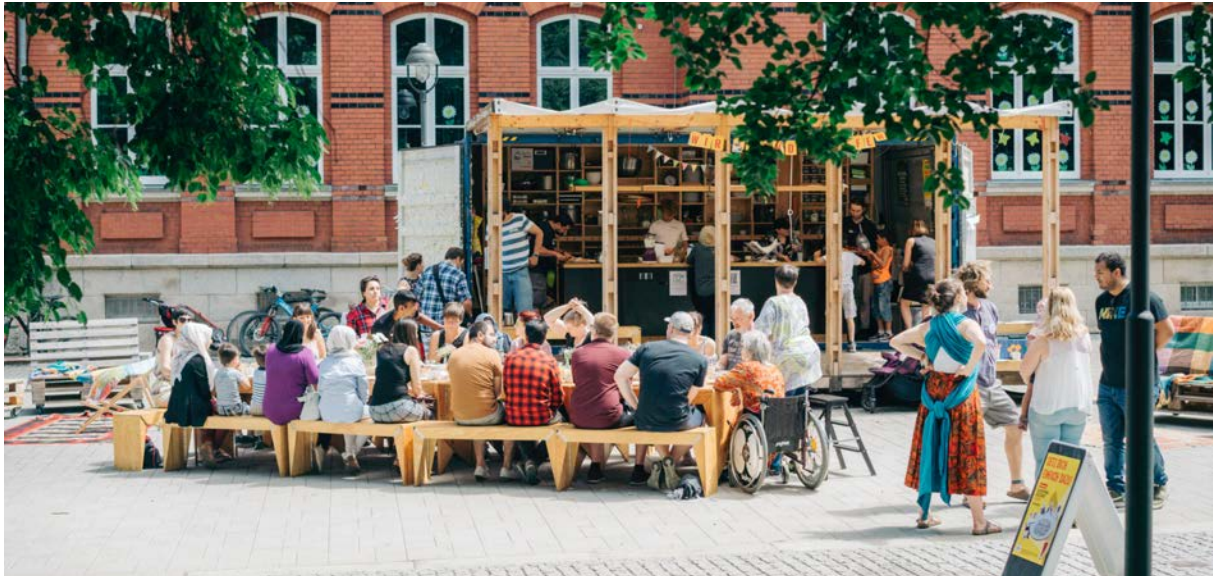
Abb. 3 Kitchen on the Run Tour, 2019

Parallel zu den Semester-Projekten werden für die Standorte der IBA27 in der Stadtregion Stuttgart sogenannte Stegreif-Entwürfe für die Aneignung, Ertüchtigung und Nutzung der Bestandsgebäude und der Außenräume der IBA27 entwickelt. Auch diese Projekte dienen als Vorbereitung von Design-Build-Projekten und weiteren Projekten des Ideenwettbewerbs, die in einer hochschul-übergreifenden Summerschool und im Wintersemester 2022/23 an den beteiligten Hochschulen und mit den Gewinner_innen des Ideenwettbewerbs zur Umsetzung kommen sollen.